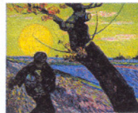
"Il seminatore" Vincent Van Gogh

Per la partecipazione è richiesto un contributo di euro 10 (per nucleo familiare).